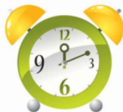
звук часового механизма