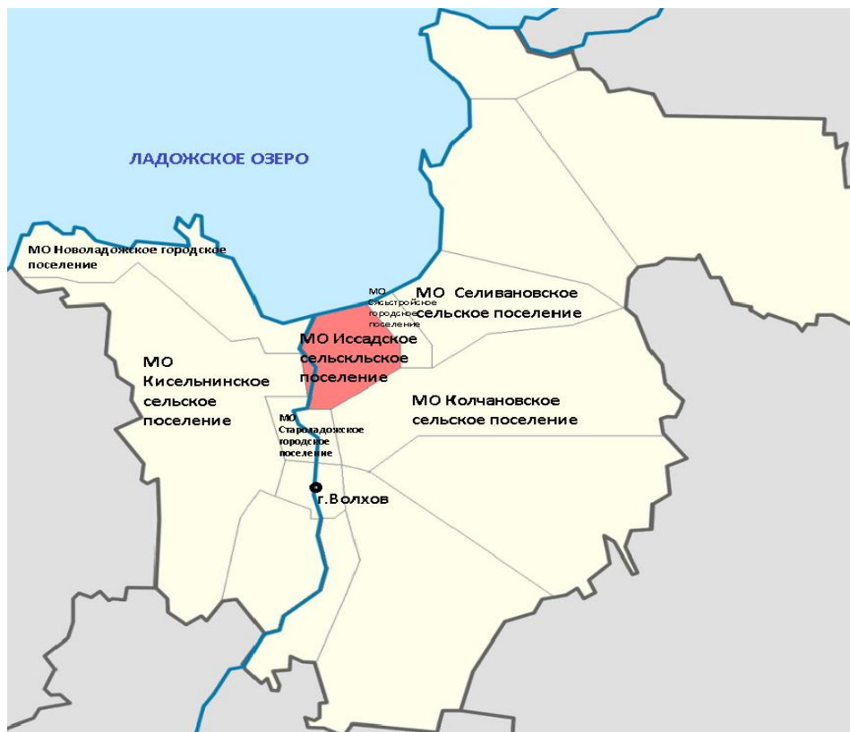
Рисунок 3.1 – Схема размещения Иссадского сельского поселения

Обосновывающие материалы и электронная модель, включающие в себя сведения по трассировкам сетей, характеристикам сетей, характеристикам и местам расположения источников теплоснабжения были предоставлены теплоснабжающими организациями согласно официальному запросу Разработчика.