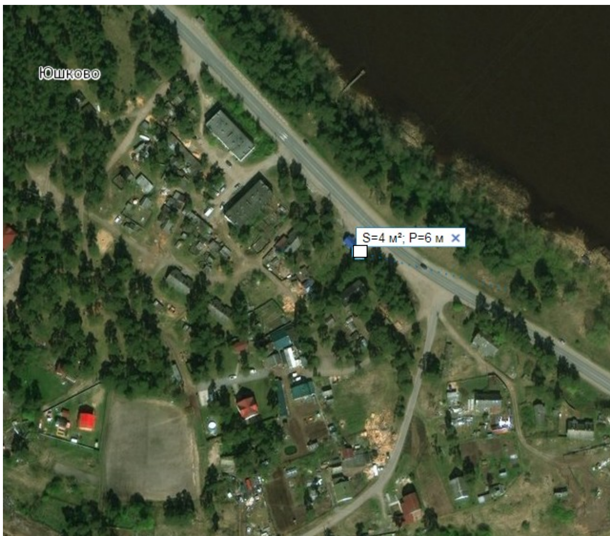
Схема размещения нестационарных торговых объектов в д. Юшково ул. Новолодожская (у д. № 44) Иссадского сельского поселения Волховского района Ленинградской области

Площадка для размещения торгового павильона S = 4 кв.м