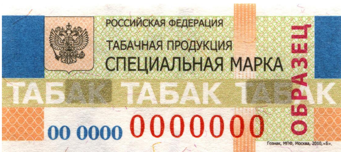
Специальная марка для всей российской табачной продукции.

На открытой витрине. В торговом зале можно разместить только перечень сигарет с ценами. Продавец может открыть витрину с табаком, только когда покупатель попросит об этом.