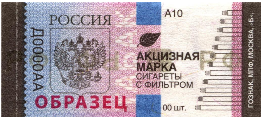
Акцизная марка для привозных (импортных) сигарет.

Без акцизных (специальных) марок. Производители сигарет сами закупают и приклеивают на пачки акцизные марки. Есть два вида марок: для местного и заграничного табака. На каждой указывают вид товара: сигареты с фильтром, сигары, сигариллы, табак трубочный. В момент приёма товара предпринимателю нужно убедиться, что на пачках есть акцизные марки.